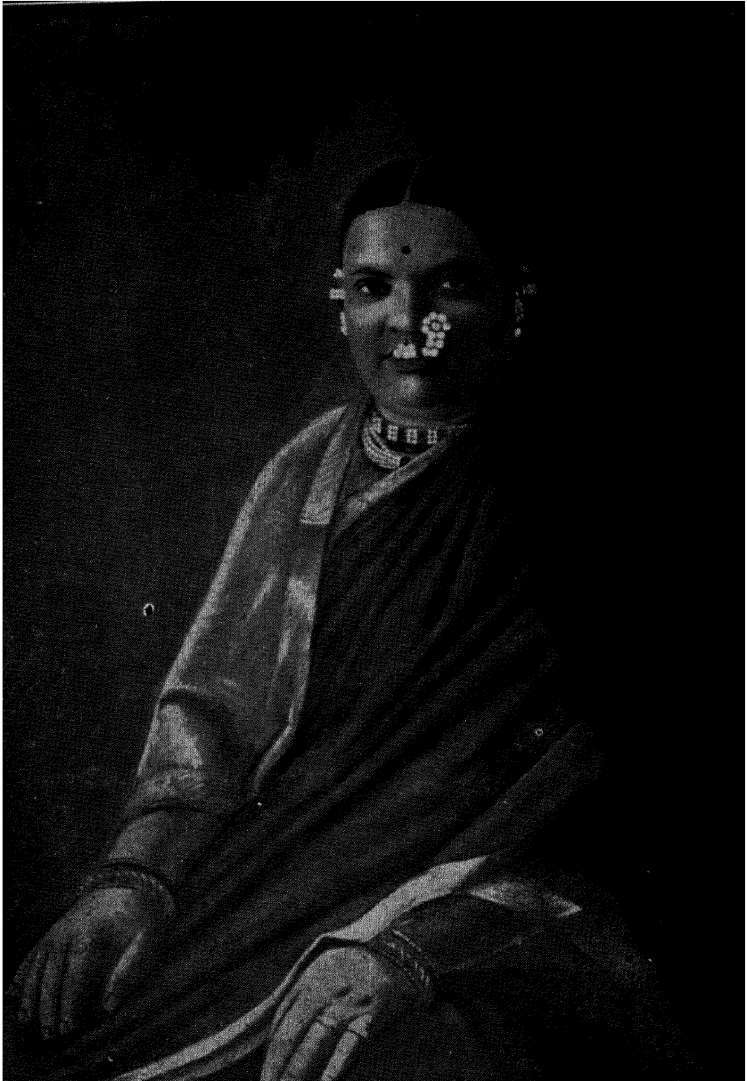
श्री. सौ. रमाबाई रानडे.